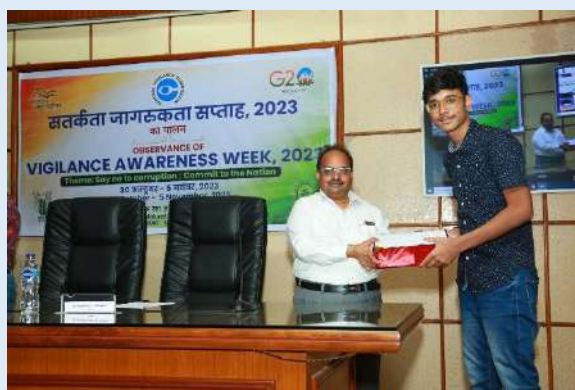
पुरस्कार वितरण/ Prize Distribution