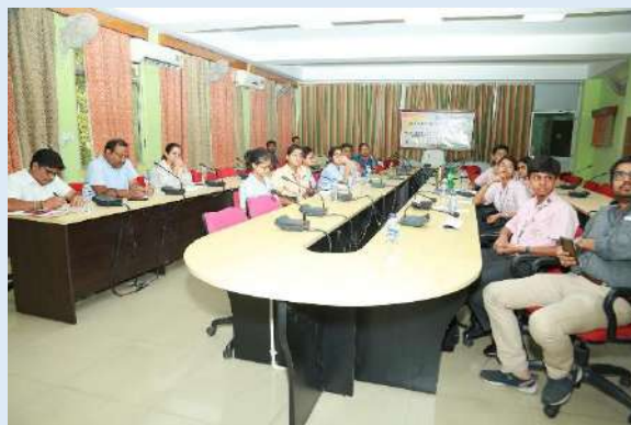
कार्यक्रम में उपस्थित प्रतिभागी/ Participants in the programme