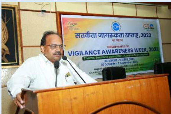
निदेशक द्वारा भाषण/ Speech by the Director