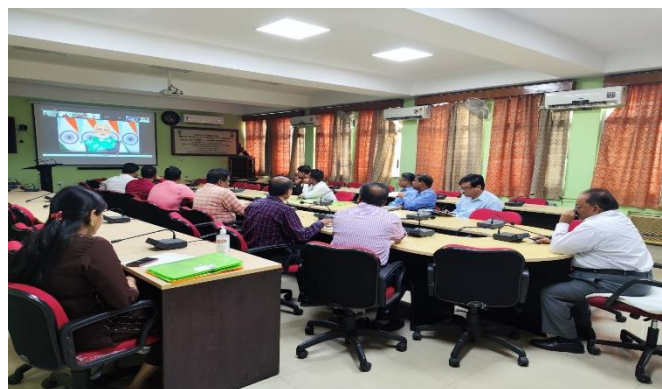
इस कार्यक्रम में शामिल प्रतिभागी/ Participants in this programme