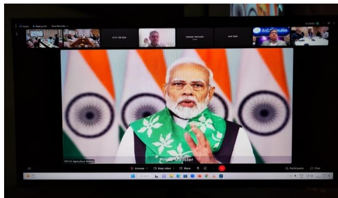
माननीय कृषि मंत्री और भारत के माननीय प्रधान मंत्री का संबोधन/ Address by Hon'ble Agriculture Minister and Hon'ble Prime Minister of India